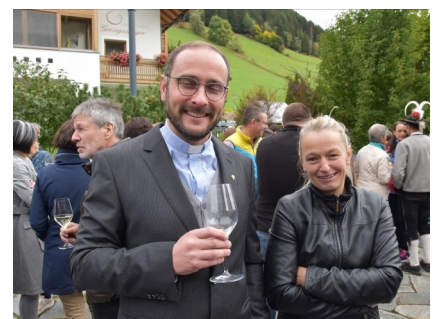
... und bei besonderen Anlässen durfte es auch ein bisschen gesellig sein.