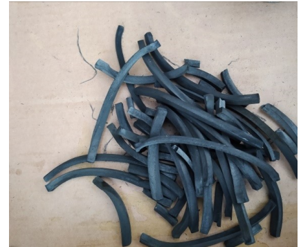
Einfacher als gedacht –selbst hergestellte Zeichenkohle aus Laubhölzern