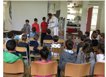
Zu den Schülergottesdiensten in der Grundschule kamen nicht nur Schüler immer gerne.