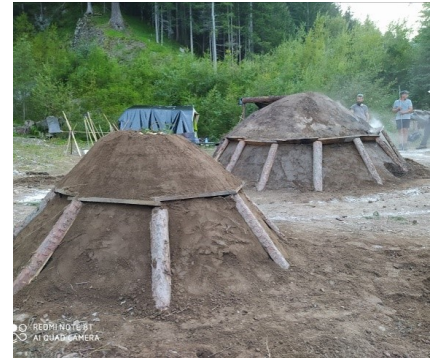
Experiment Kindermeiler: Hier verkohlt 1 m 3 Hartholz in etwa 24 Stunden.

bot (fast) alles, was ein guter Kohlplatz haben muss. Die Stelle liegt abseits bewohnter Gebiete und ist trotzdem leicht zu Fuß und bei Bedarf auch mit schweren Maschinen vom Dorf aus erreichbar. Auch das notwendige Wasser ist ausreichend vorhanden. Einzig der Wind blies unerwartet konstant vom Kahlbach herunter und erschwerte ein gleichmäßiges Verkohlen des Meilers. Aber die Ruhe und das herrliche Panorama machten den kleinen Nachteil mehr als wett.