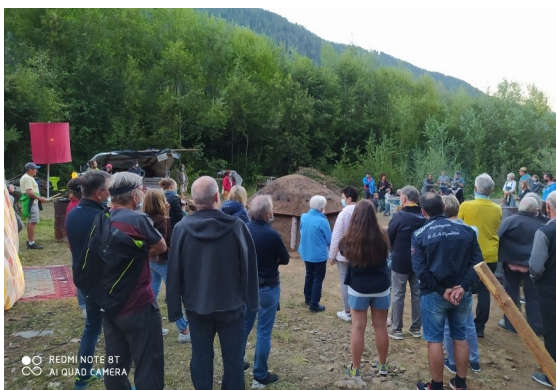
„Das Loch im Geist“, eine poetische Performance, war Teil der Veranstaltungsreihe „Antrischis Toul“