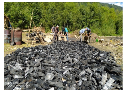
Aus 100 kg Fichten- und Lärchenholz können etwa 30 kg Holzkohle gewonnen werden. Zu 98% bleibt nur das Kohlenstoffgerüst der Holzzellen übrig.