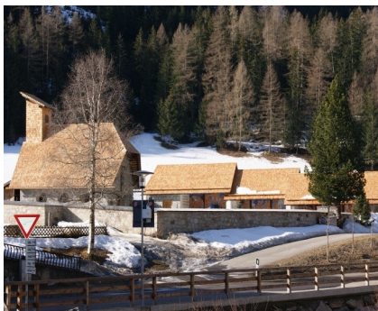
Erneuerung der Schindeln im Sommer 2011