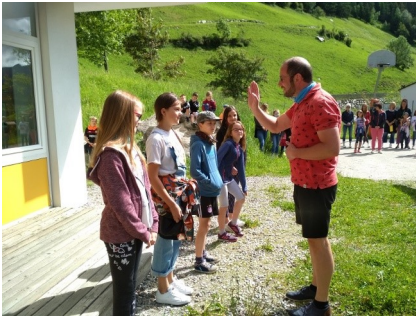
Schulabschlussfeier auf dem Pausenhof im Jahr der Abschiede. Wehmut trifft Vorfreude aufs Neue.