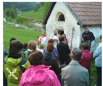
Bittgang zum Feucht-Steckl