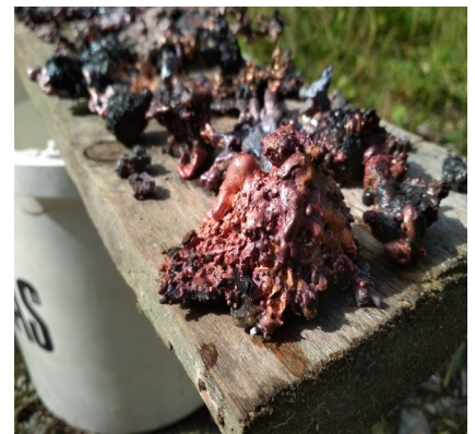
Kleine Erinnerungen an das experimentelle Kupferschmelzen im Esllüoch