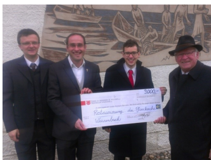
... mit wertvoller Unterstützung der Stiftung Südtiroler Sparkasse