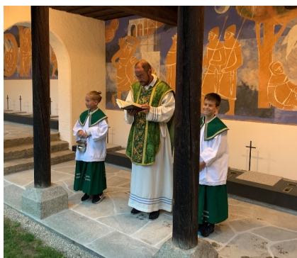
Rechtzeitig vor dem Abschied aus Weißbach konnten im August 2020 die Urnengräber geweiht werden.