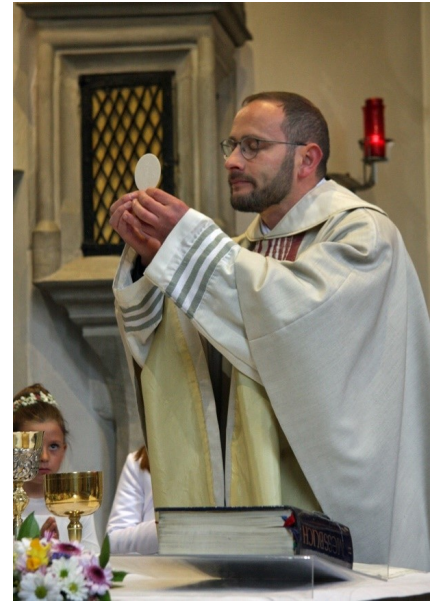
Alljährlich ein Höhepunkt im kirchlichen Jahreskreis: Der Empfang der ersten Hl. Kommunion