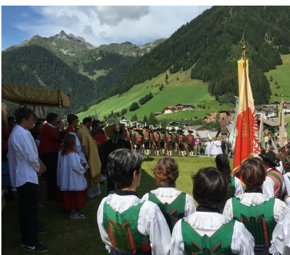
Ein Höhepunkt des „Weißenbacher Kirchenjahres“ - die Jakobiprozession