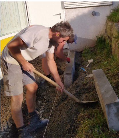
Wie beim Friedhof, so auf dem Pausenhof. Vielen Dank für die wertvolle Unterstützung durch die Fraktion.